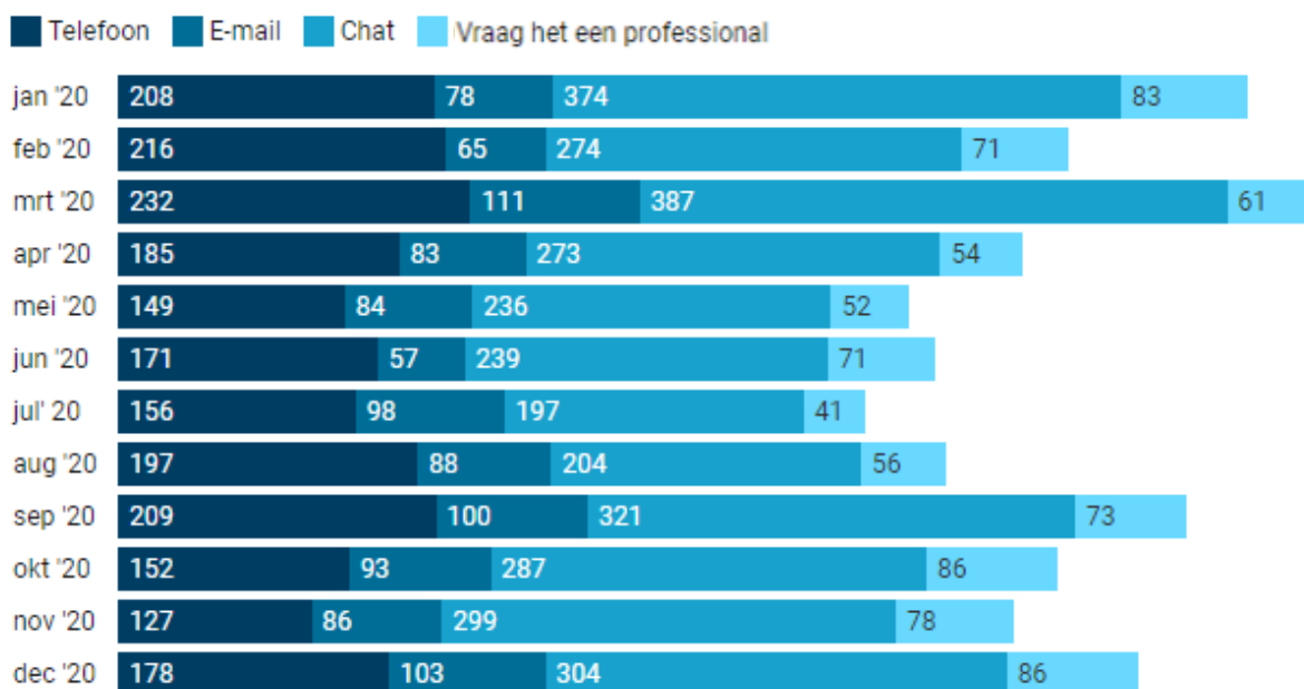
Figuur 3 Ontwikkeling Kanker.nl infolijn