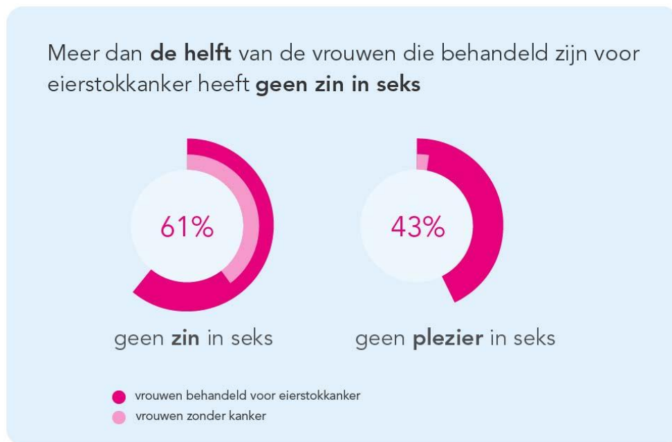
Figuur 2: Intimiteit en seksualiteit