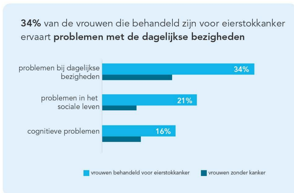
Figuur 3: Belemmeringen functioneren

1 op de 6 vrouwen heeft last van problemen met denken na de behandeling, zoals iets onthouden of je aandacht ergens bij houden (cognitieve problemen). Vrouwen die geen kanker hebben gehad, hebben minder vaak last van deze problemen.