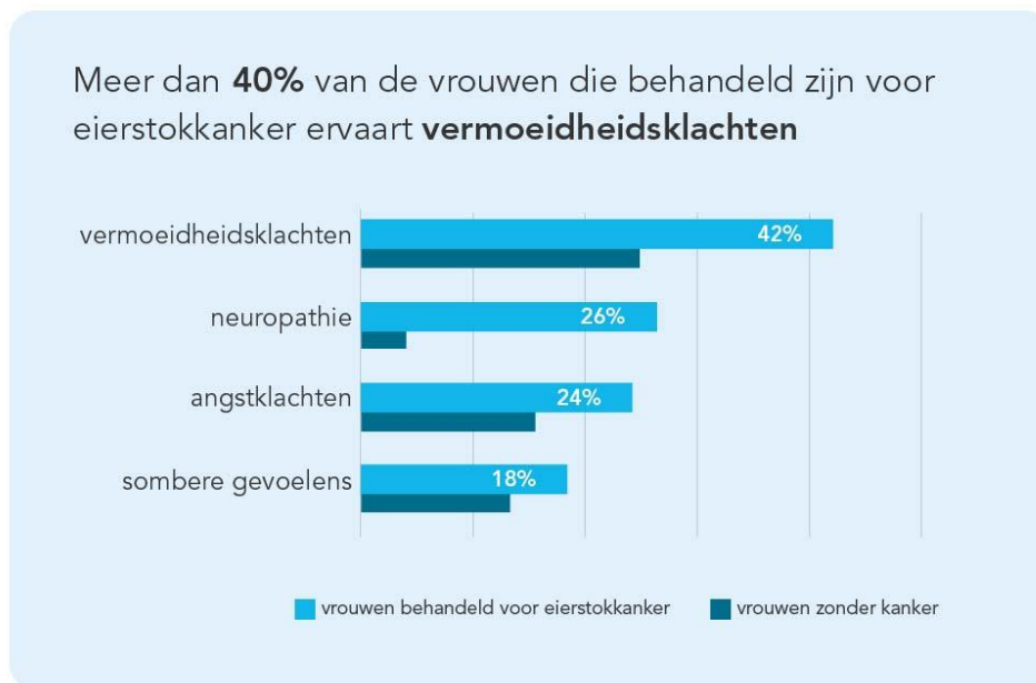
Figuur 1: Fysieke en mentale gezondheid

Ernstige vermoeidheid, neuropathie en angstklachten komen ook voor bij vrouwen die geen kanker hebben gehad, maar minder. Ze hebben wel even vaak last van sombere gevoelens.